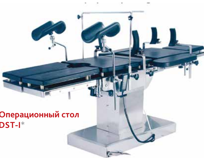
Операционный стол DST-I*