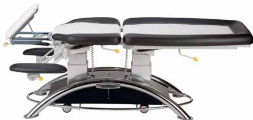
Массажный стол Lojer Capre 125 E 3 секции*

*Самые популярные модели оборудования марки Lojer среди наших клиентов