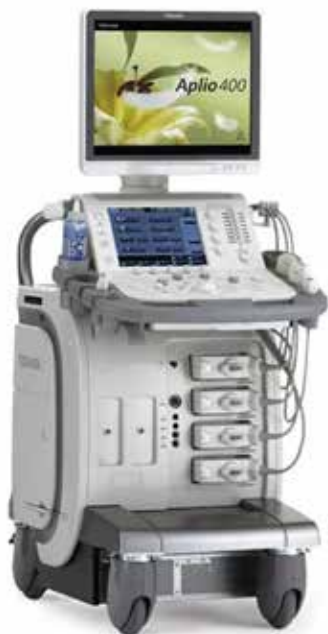
Модель: Ультразвуковая система экспертного класса Canon Aplio 400*