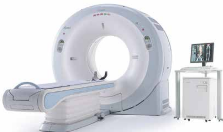
Модель: Компьютерный томограф Aquilion RXL*

*Самые популярные модели оборудования марки Toshiba Medical среди наших клиентов