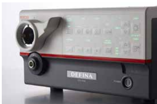
Видеопроцессор DEFINA EPK-3000*

*Самые популярные модели оборудования марки Pentax medical среди наших клиентов