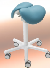
Scan-Cast FIT Pro