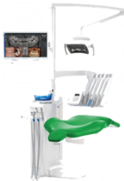
Compact™ Classic NEW